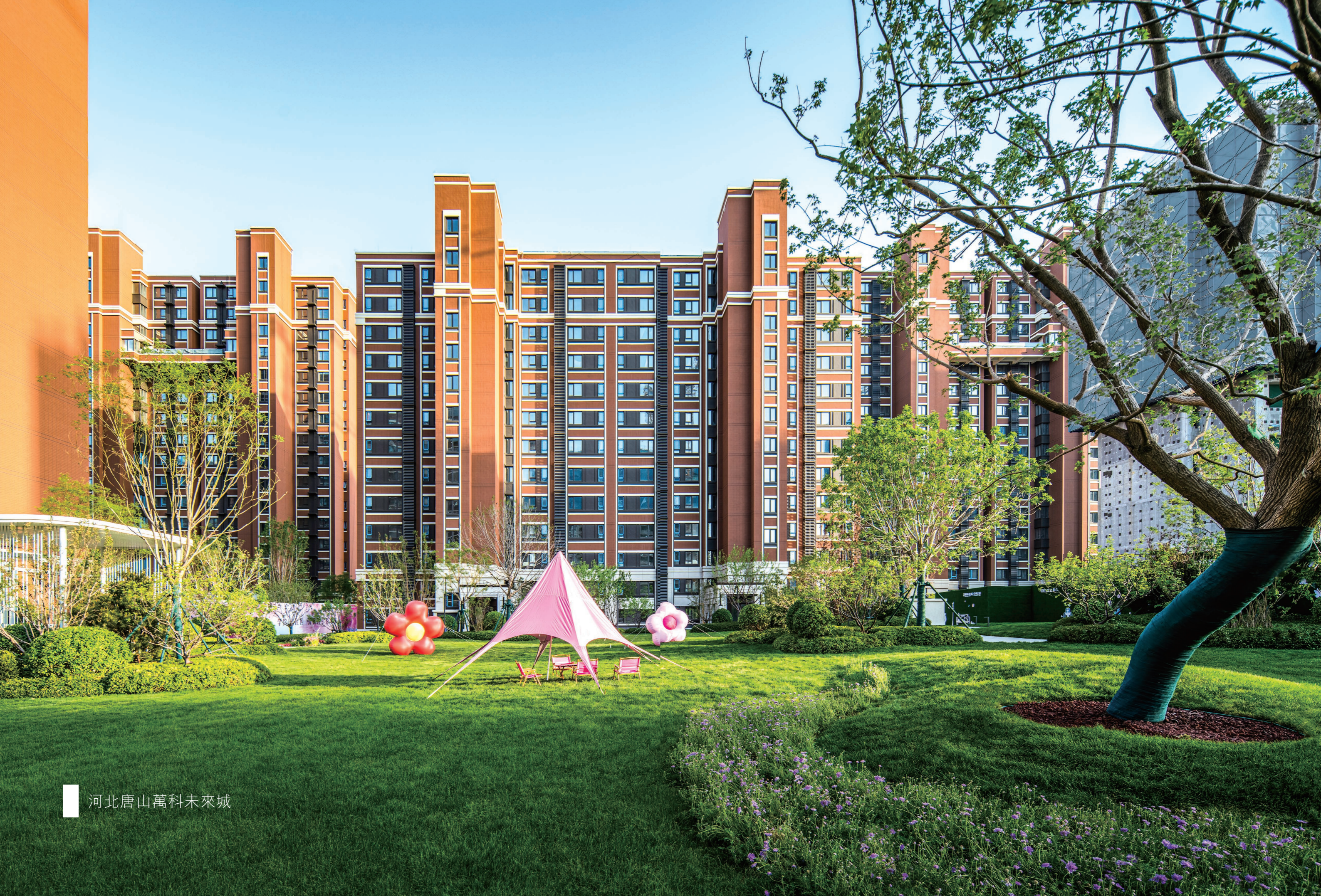
河北唐山萬科未來城