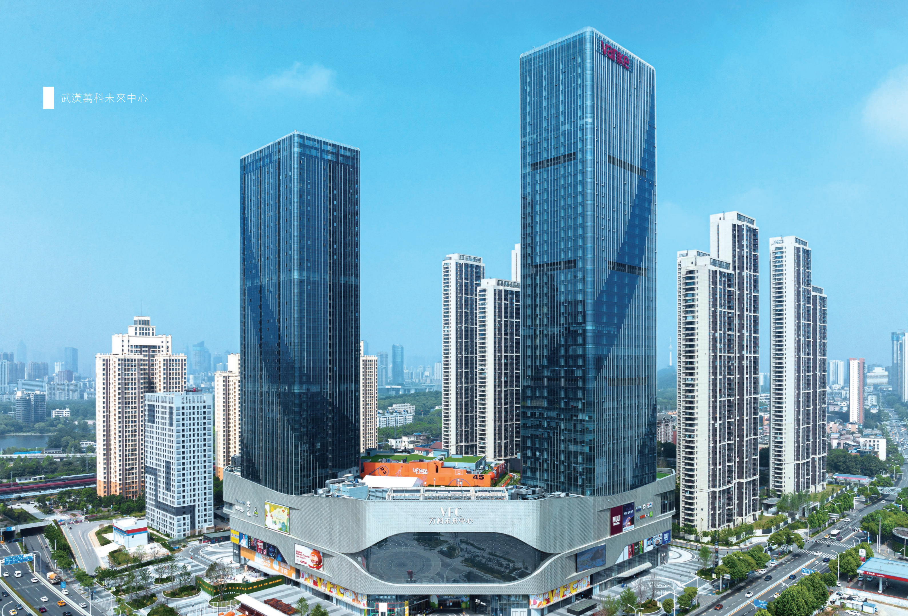
武汉万科未来中心