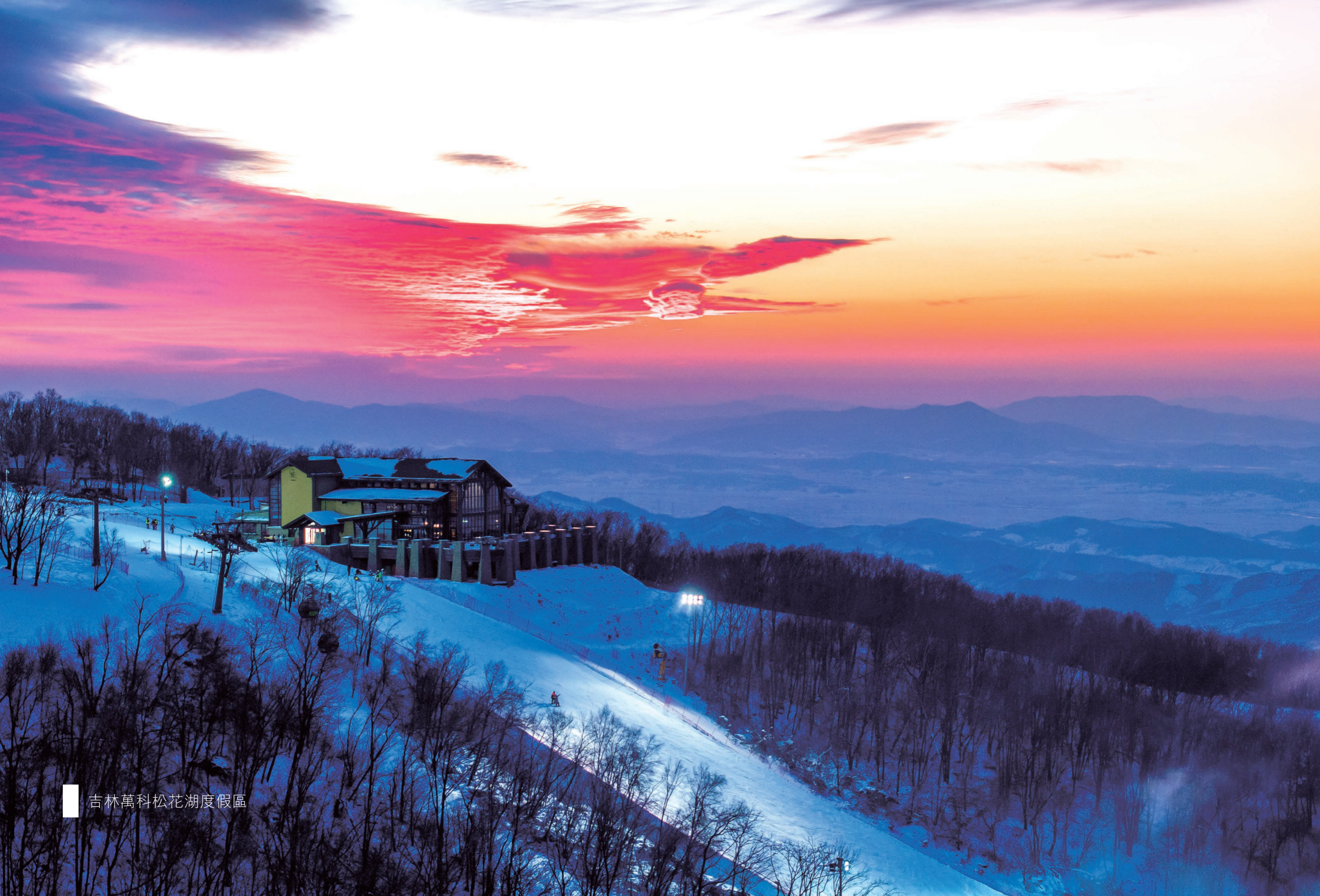
吉林萬科松花湖度假區